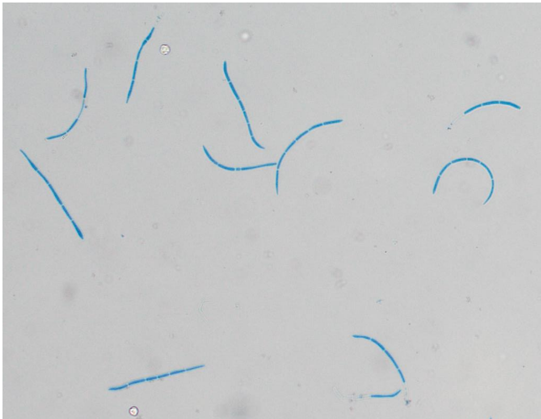
Konidien von Septoria betulae (gefärbt)