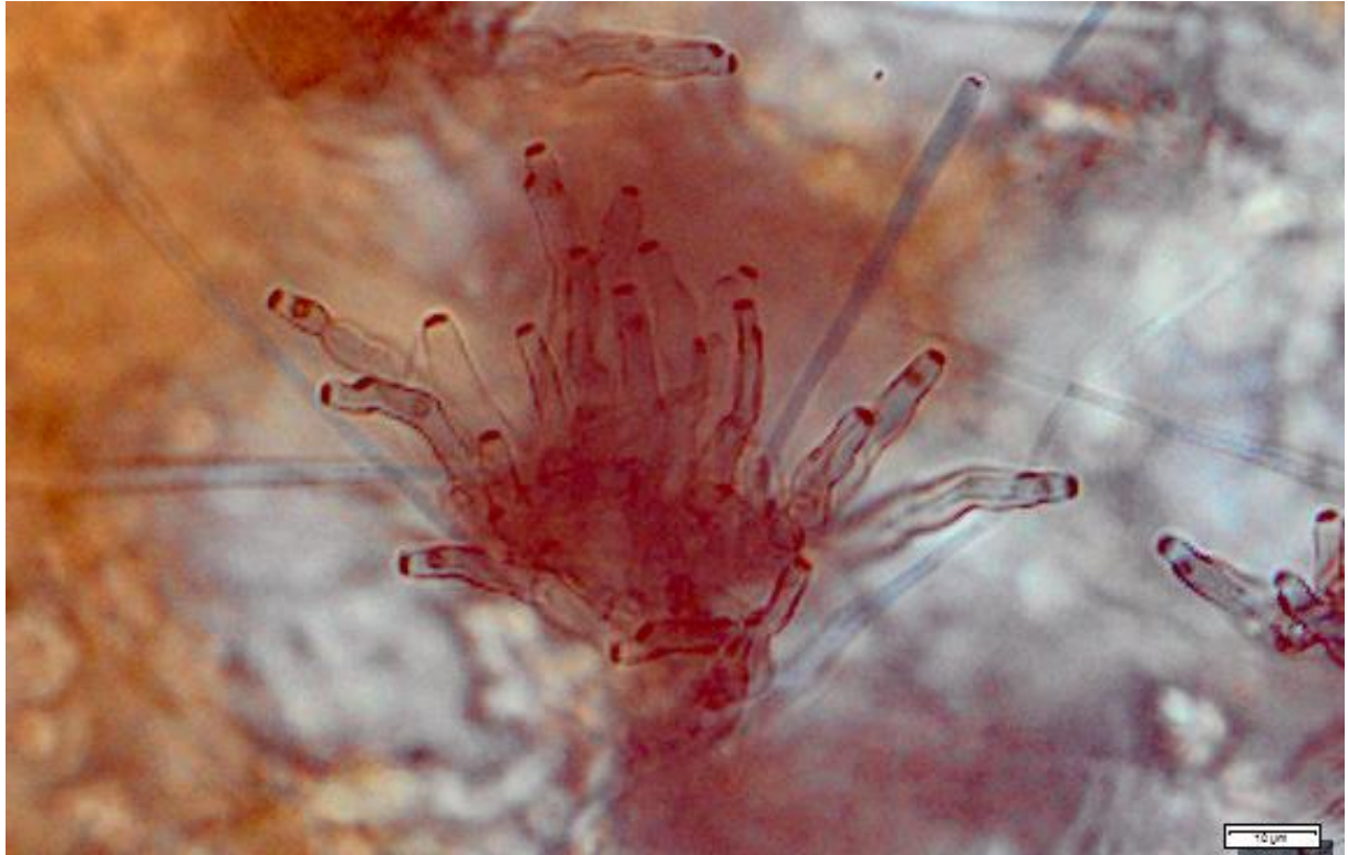
Konidienträger von Cercospora beticola (gefärbt)