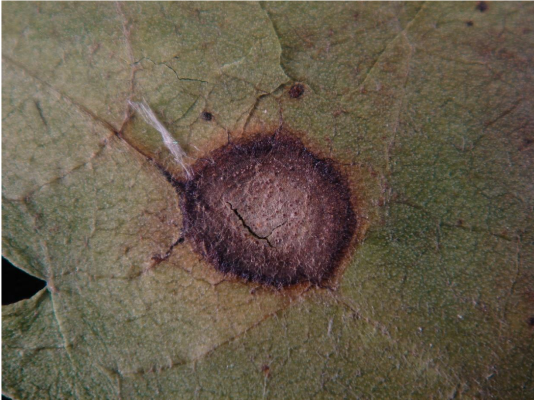
Pyknidien auf dem Blattfleck