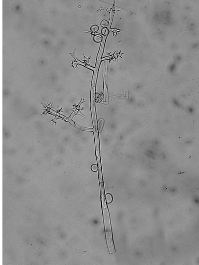
Sporangiophor und Sporangien

Auf lebenden Blättern von Xanthium strumarium .